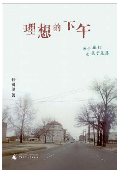
理想的下午...关于旅行也关于晃荡